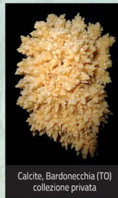
Calcite, Bardonecchia (TO) collezione privata