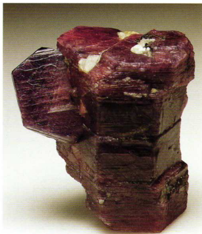
Corindone: gruppo di cristalli policromi di 6 cm. Amboarohy. Coll. privata.

norma maggiore ai 50 ppm; esso si conferma quindi un importante cromoforo per gli zaffiri. Quando il titanio è contenuto in quantità minori di 50 ppm, la colorazione dei campioni appare rossa