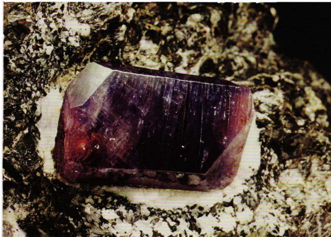
Corindone: cristallo policromo di 2,5 cm in matrice. Amboarohy. Coll. F. Demartin.

riconoscibili le tracce di pseudo-sfaldatura secondo angoli di 120^\circ (Leone et al. , 1995). Lungo queste zone la colorazione è spesso disomogenea. Alcuni campioni mostrano evidenti tace di geminazioni fra diversi individui, ben riconoscibili dagli angoli rientranti.