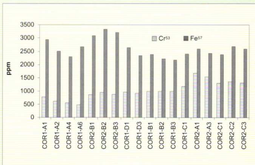
Fig. 1. Stima (parti per milione) relativa al contenuto di ferro e cromo nei campioni analizzati. I campioni a destra sono di colorazione rossa più intensa e presentano un maggior tenore di Cr.