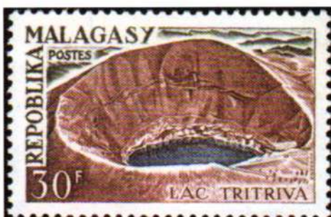
Madagascar 1962 Lago Tritriva (Y.T. 366)