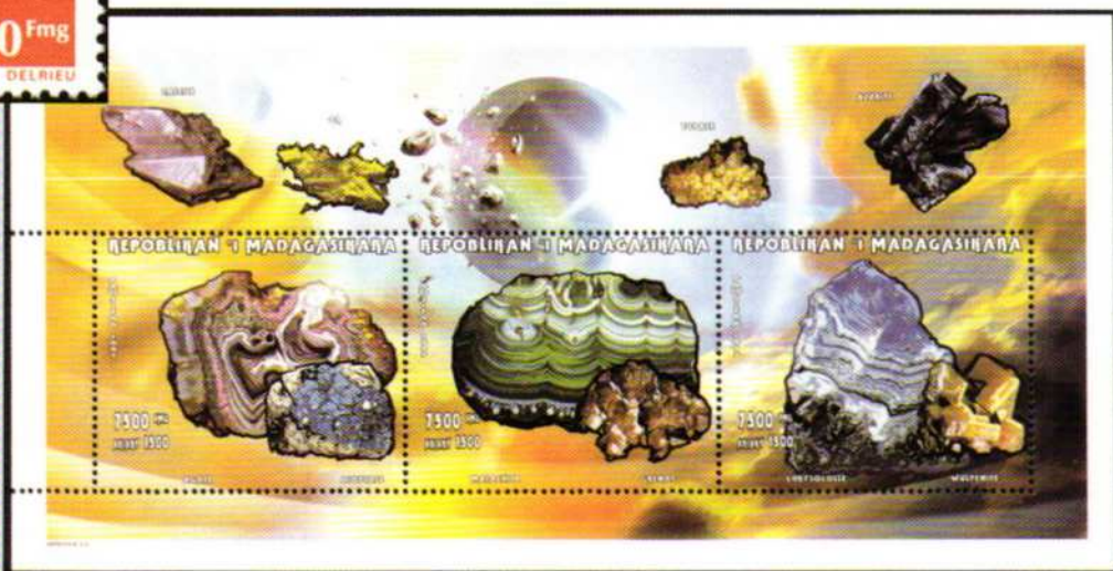
Madagascar 1997. Minerali (Y.T. 1511-1513)