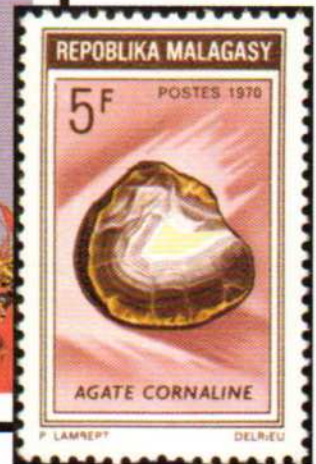
Madagascar 1970. Agata (Y.T. 472)