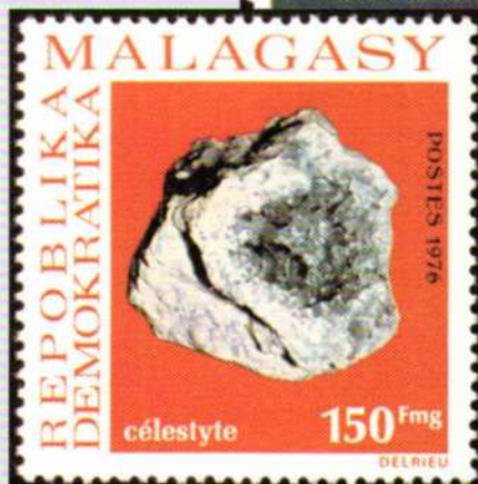
Madagascar 1976. Celestina (Y.T. 592)

Si ringraziano le Edizioni Yvert & Tellier che hanno concesso l'autorizzazione ad utilizzare le numerazioni e le valutazioni riportate nei loro cataloghi