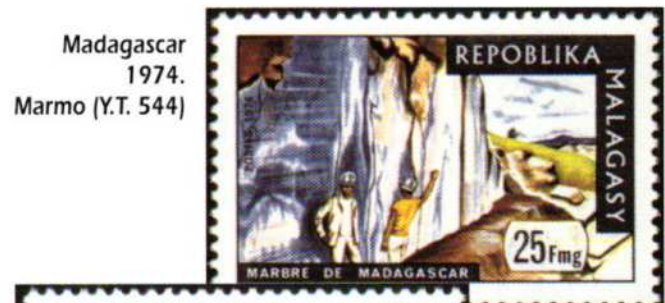
Madagascar 1974. Marmo (Y.T. 544)