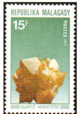
Madagascar 1971. Quarzo ematoide (Y.T. 483)