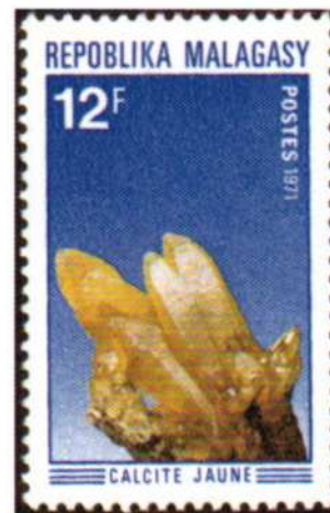
Madagascar 1971. Calcite gialla (Y.T. 482)