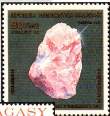
Madagascar 1989 Quarzo rosa (Y.T. 910)

A cura di Alberto Berti, Via delle Ande, 5 - 20151 Milano. E-mail: al.berti@iol.it