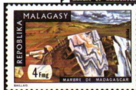
Madagascar 1974. Marmo (Y.T. 543)