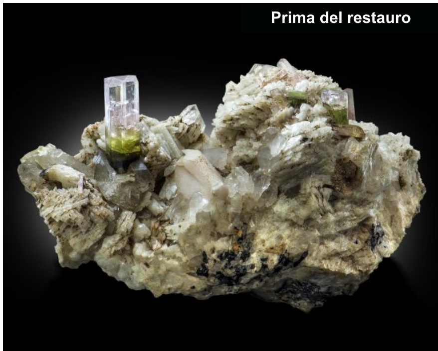
Prima del restauro

Il Museo di Storia Naturale - Sistema Museale di Ateneo dell'Università di Firenze ha fatto restaurare alcuni campioni dei famosi 5000 elbani con eccellenti risultati