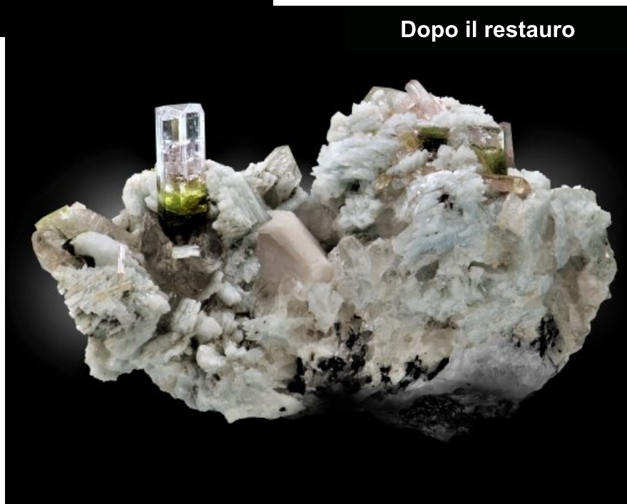
Dopo il restauro

Campione della Collezione Mineralogica del Museo di Storia Naturale Sistema Museale di Ateneo Università di Firenze Collezione Giorgio Roster Inv. n. E4076.